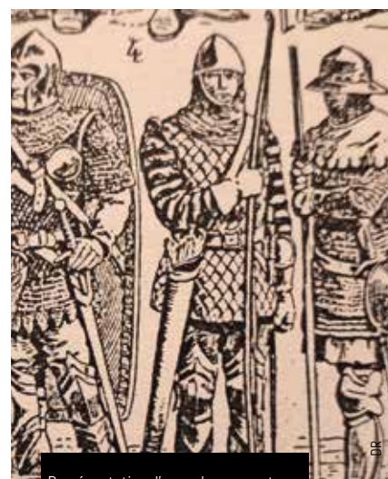
Représentation d'un archer au centre