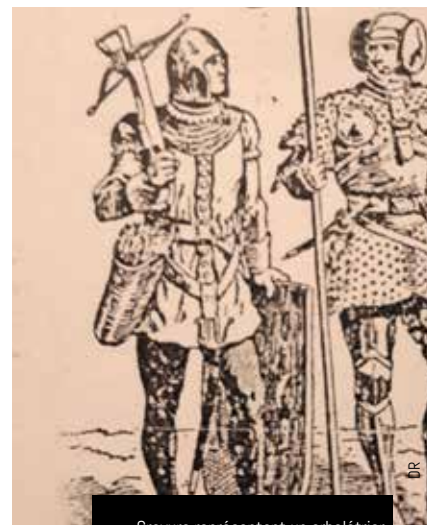
Gravure représentant un arbalétrier