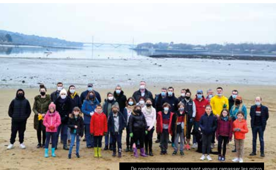
De nombreuses personnes sont venues ramasser les micro et macro déchets découverts par la marée basse au Douvez

Le 22 janvier, la journée de nettoyage de la plage de Pen an Traon au Douvez a mobilisé une cinquantaine de personnes. Cette opération a également servi à mettre un coup de projecteur sur l'étude menée par le syndicat de bassin de l'Élorn et a permis d'inaugurer un bac à marée. Un outil mis à la disposition de tous les promeneurs par les enfants du conseil municipal des jeunes (CMJ) et de la Maison des jeunes (MDJ).