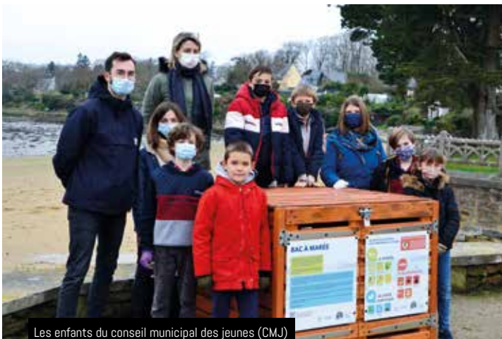
Les enfants du conseil municipal des jeunes (CMJ) ont présenté le 22 janvier 2022 le bac à marée