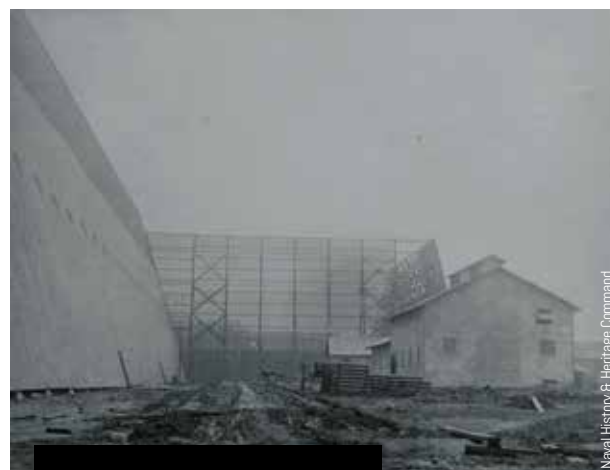
Le camp américain de Lanrus en construction